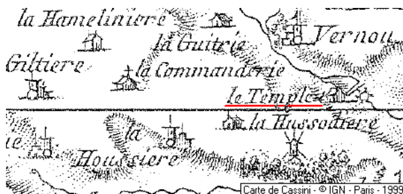
Localisation: Maison du Temple de Villemoisan

Département: Maine-et-Loire, Arrondissement: Angers, Canton: Louroux-Béconnais - 49