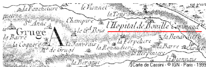
Maison du Temple de Grugé-l'Hôpital

L'Hôpital est un petit bourg entre Bouillé-Ménard et Grugé, qu'un décret du 2 janvier 1808 a réuni à la commune de Grugé, dite dès lors Grugé-l'Hôpital.