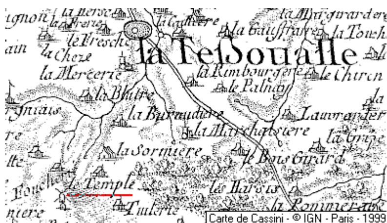
Localisation: Le Temple de La Tessoualle