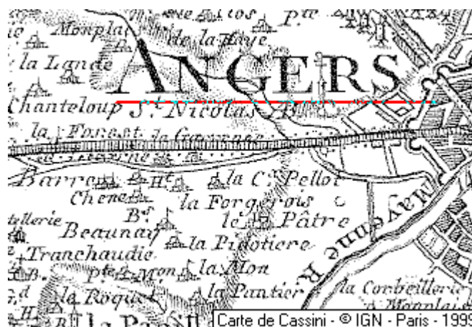
Localisation: Maison du Temple d'Angers

Département: Maine-et-Loire, Arrondissement et Canton: Angers - 49