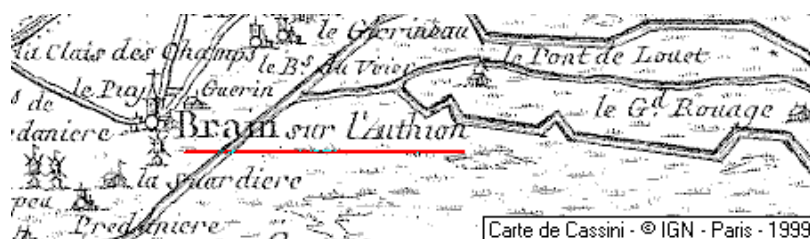
Localisation: Domaine du Temple de Brain-sur-l'Authion

Département: Maine-et-Loire, Arrondissement: Angers, Canton: Angers-Trélazé - 49