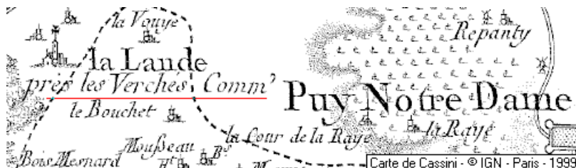
Localisation: commanderie de La Lande