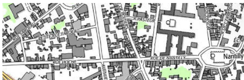
Localisation: Maison du Temple de Saumur

Département: Maine-et-Loire, Arrondissement et Canton: Saumur - 49