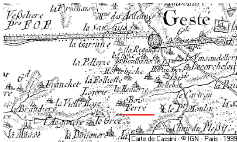
Localisation: Maison du Temple du Bois-Ferré

Bois-Ferré, ancienne commanderie templière (1), avait également une chapelle Saint-Jean. La Maison du Bois-Ferré fut réunie vers la fin du XVe siècle au temple de Clisson.