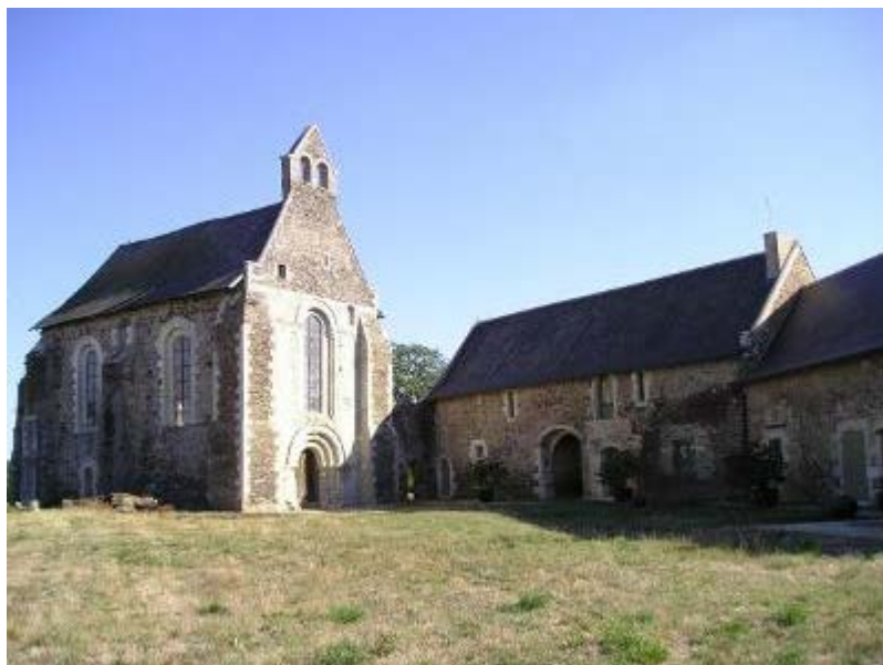
Chapelle de Villemoisian

— Vers le Nord, un peu à l'écart de la route de Louroux, établie depuis le XIIe siècle, une Maison du temple, annexe de la Maison du Temple Saint-Laud d'Angers, et désignée d'ordinaire sous le nom de l'Hôpital Béconnais.