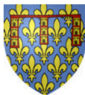
Robert 1 er