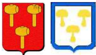
Mailly de Bourgogne non identifié (bordure d'azur)

sceau à un maillet : plus ancienne représentation des armes des Mailly (Baudouin, 11/1223 ; 1279) ; écu à trois maillets (Gilles 1 er , 03/1239, hommage au comte d'Artois)